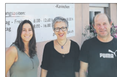
Betrieb mit Geflügelhaltung