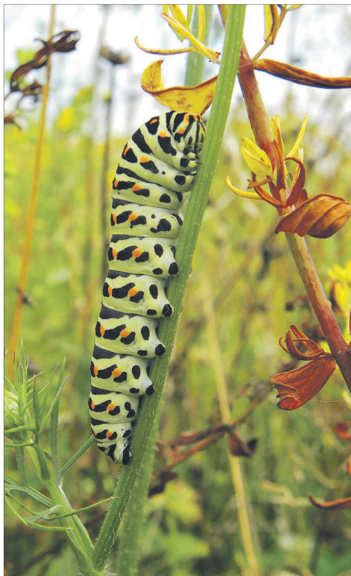
Eine Raupe des Schwalbenschwanz-Schmetterlings. Als Faustregel gilt: Eine Pflanzenart bietet Nahrungs- und Nistort für zirka zehn Tierarten, vor allem Insekten.

Ammoniak / Artenverarmung und zerstörte Lebensräume vieler Insekten und anderer Tiere sind nur einige der Folgen, wenn Ökosysteme überdüngt werden.